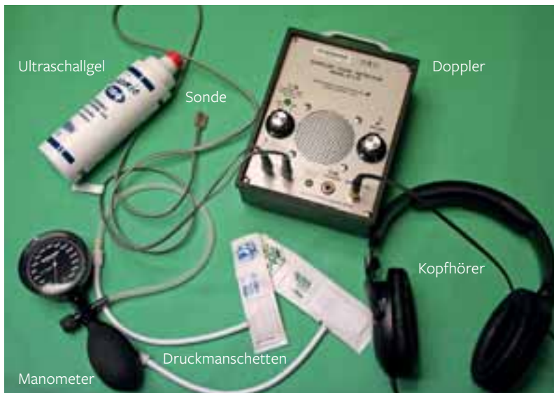
Abb. 2: Das notwendige Equipment zur Blutdruckmessung

licher Untersuchungen eingesetzt wird. Die indirekten Messverfahren sind in ihrer Praktikabilität alltagstauglich und entsprechende Geräte sind inzwischen in vielen Praxen vorhanden.