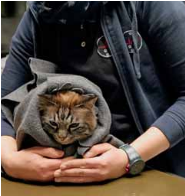
Abb. 10: Auf dem Behandlungstisch können wir einen sicheren Platz imitieren, indem wir der Katze eine Höhle mit unserem Körper bieten.

öffentlich propagierte Vorsorgeuntersuchungen und das Angebot von Senior-Checks mit Erinnerungsfunktion oder sei es durch eine wunderschöne stressfreie Katzenpraxis – der Erfolg dieser Maßnahmen hängt immer noch an der Compliance der KatzenbesitzerInnen.