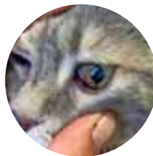
Abb. 1: Blutung in die vordere Augenkammer einer Katze

Bei der Blutdruckmessung mittels Doppler wird der Blutfluss in einem Gefäß von einer fingernagelgroßen Ultraschallsonde aufgenommen und im Dopplergerät in ein akustisches Signal umgewandelt. Dazu soll die Haut über dem Gefäß geschoren und mit Ultraschallgel für eine gute Ankopplung vorbereitet sein. Proximal des Gefäßes wird eine dem Gliedmaßenumfang angepasste Manschette angelegt, die mit einem Manometer versehen ist. Bei lockerer Manschette suchen wir das akustische Signal des Blutflusses auf, dass sich als „pulsierendes“ Geräusch darstellt. Nun wird die Manschette mithilfe des Manometers aufgepumpt, bis das Geräusch endet, d. h. der Blutfluss sistiert. Indem wir sehr langsam den Druck von der Manschette entweichen lassen, finden wir den Punkt, an dem das Blut erneut durch das Gefäß fließt und das Geräusch zu hören ist. Am Manometer lässt sich der entsprechende Druck ablesen, der dem systolischen Blutdruck entspricht. Die Dopplermessung ist mit etwas Übung (das Auffinden des Gefäßes mit einem darstellbaren Blutfluss gelingt nicht immer beim ersten Mal und erfordert manchmal Geduld und Fingerspitzengefühl) eine sehr gut nachvollziehbare und zuverlässige Messmethode.