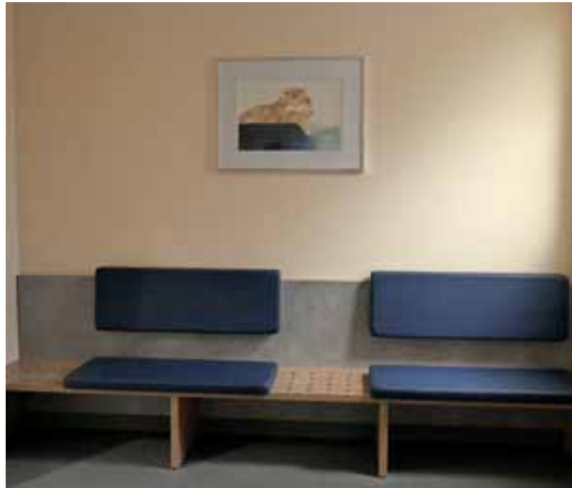
Abb. 11: Auch im Wartezimmer gibt es erhöhte Plätze für die Katzenkörbe.

Die Information über die Gefahr, die vom Bluthochdruck ausgeht, muss regelmäßig angesprochen werden. Wir geben BesitzerInnen älterer Katzen Informationszettel und erklären den Inhalt ausführlich. Kommt eine Katze im Alter ab 8 Jahren in die Praxis, wird wie selbstverständlich zuerst Blutdruck gemessen. Die BesitzerInnen sind meistens positiv überrascht, denn das kennen sie zwar nur von eigenen Arztbesuchen, verstehen aber sofort die Sinnhaftigkeit. Nun ist es wichtig, am Ball zu bleiben und den Kontrolltermin, je nach gemessenem Druck, zeitnah oder nach sechs Monaten sofort zu vereinbaren. Auch die Einbeziehung neuer Medien wie der Praxishomepage oder des praxiseigenen Facebook-Auftrittes können gute Hilfe leisten, um die Gefahr des „stillen Killers“ in das Bewusstsein der BesitzerInnen älterer Katzen zu rücken. Wichtig dabei ist natürlich