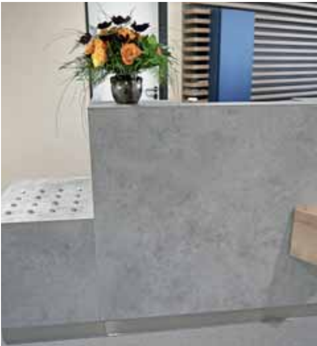
Abb. 8: Erhöhte Abstellmöglichkeit für den Katzentransportkorb am Tresen