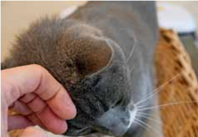
Abb. 13: Wenn die Katze ihre Stirn gegen die Hand der Tierärztin oder Helferin presst, haben wir gewonnen.