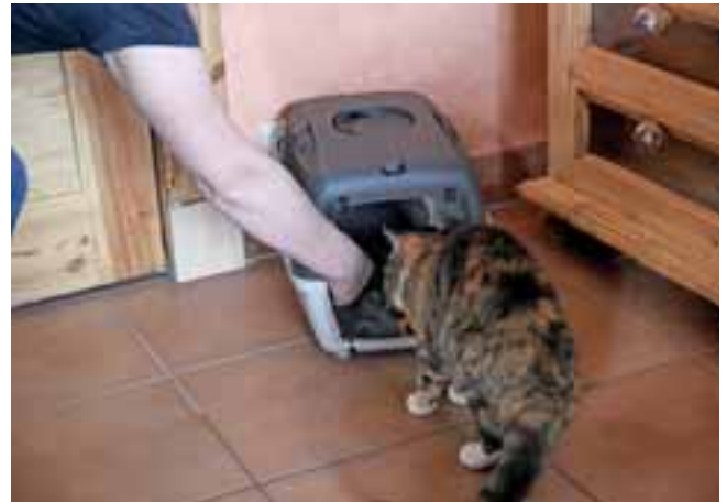
Abb. 14: Katzenkorbtraining – eine Anleitung für Katzenbesitzer ist ideal.

auch, dass die BesitzerInnen sich vor Augen führen, dass ihre Katze in ein Alter kommt, in dem chronische Krankheiten häufiger auftreten. Ist diese Erkenntnis angekommen, lassen sich regelmäßige geriatrische Untersuchungen gut etablieren und enthalten nicht nur die Blutdruckmessung, Zahn- und Gewichtskontrolle, sondern auch eine jährliche Blutuntersuchung.