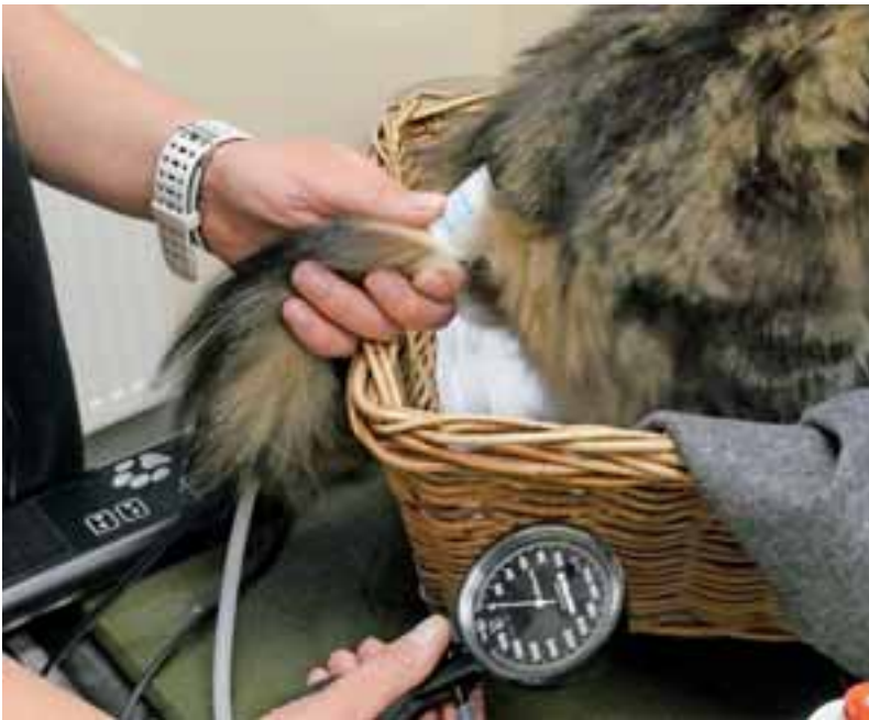
Abb. 7: Sobald der Kontakt gut ist, hört man das Geräusch des Pulses. Die Sonde liegt mit dem Schwanz in der linken Hand, die rechte Hand bedient das Manometer.

suchs werden sie in einen Transportkorb gebracht, meistens mit dem Auto transportiert, kommen in der Praxis an, wo sie mit Hunden, fremden Menschen, fremden Gerüchen, unangenehmen Geräuschen und nicht zuletzt mit der Untersuchung auf dem Behandlungstisch konfrontiert werden. Stress und Frustration entstehen bei allen diesen Erlebnissen und kumulieren, bis sie in der Summe zu einer Katze im absoluten Ausnahmezustand führen. Bei diesen Patienten ist meist eine Blutdruckmessung