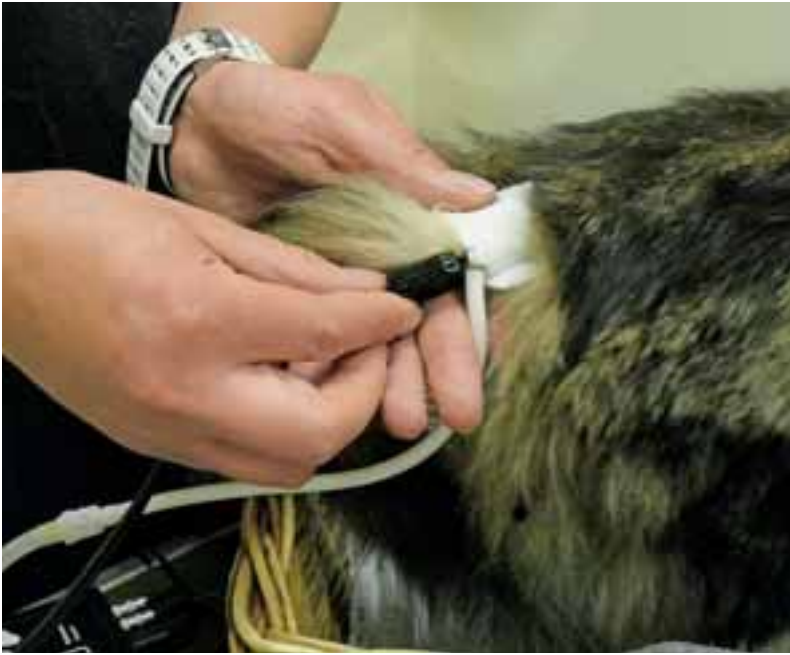
Abb. 6: Die Sonde wird mit Gel versehen auf die rasierte Stelle aufgelegt.