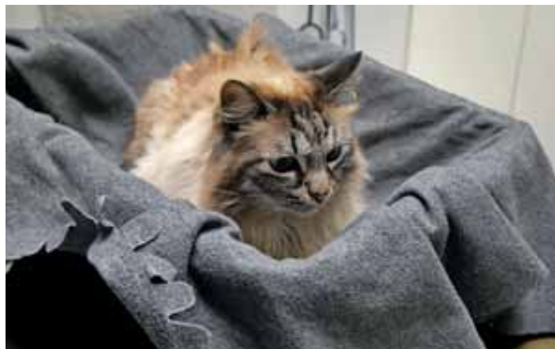
Abb. 12: Der Weidenkorb und die „Pheromondecke“ sind die ideale Kombi, um der Katze Angst und Stress zu nehmen.