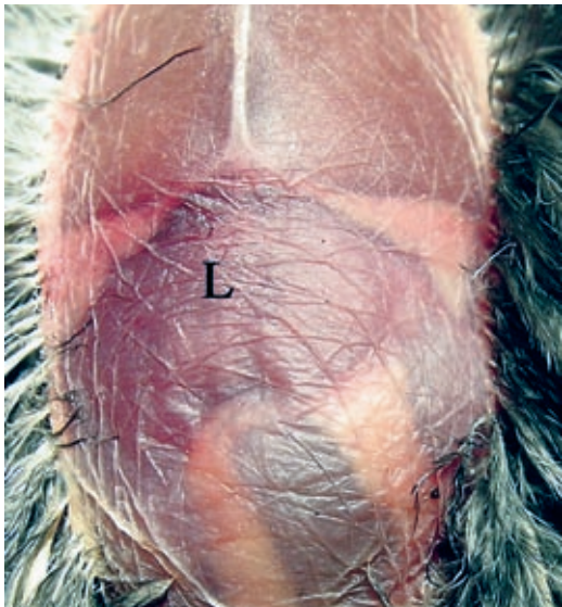
EISENSPEICHERKRANKHEIT BEI BLATTVÖGELN: Durch die Bauchwand sichtbare vergrößerte Leber-silhouette. Seite 362