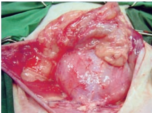
INGUINALE FETTGEWEBSNEKROSE DER KATZE: Operationssitus vor Resektion des nekrotischen Gewebes. Seite 353